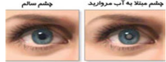
آب مروارید عبارت است از کدر شدن عدسی چشم

آب مروارید به کدر شدن عدسی چشم می گویند. عدسی یا لنز مانند لنز دوربین کار می کند و نور را بر روی پرده شبکیه که در عقب چشم قرار دارد متمرکز می کند و شخص می تواند هم دور و هم نزدیک را ببیند. عدسی به طور عمده از آب و پروتئین تشکیل شده است. پروتئین ها طوری قرار گرفته اند که باعث شفافیت عدسی می شوند، در نتیجه نور از آنها عبور می کند.